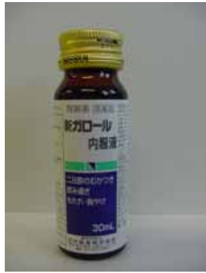
新ガロール内服液（瓶）