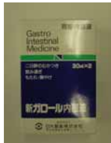
新ガロール内服液（2本入）