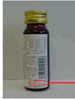
製造番号位置(ラベル右下)