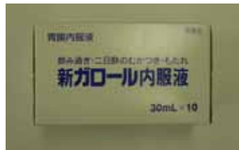
新ガロール内服液（10本入）